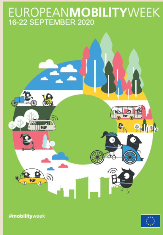
Algunas llevan mascarillas